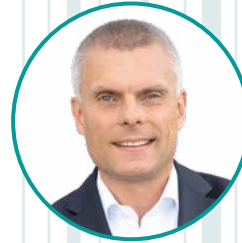
Bernd Düsterdiek Beigeordneter, Deutscher Städte- und Gemeinde- bund