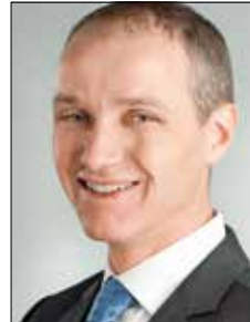
TÜV SÜD ImmoWert GmbH

Die TÜV SÜD ImmoWert bewertet Handelsimmobilien nach nationalen und internationalen Standards. Mit acht Standorten und über 40 fest angestellten Gutachtern sind wir einer der größten unabhängigen Immobilienbewertungsgesellschaften in Deutschland. Dabei kooperieren wir eng mit der BBE und der IPH. So stellen wir sicher, dass unsere Wertgutachten immer dem aktuellsten Stand der schnelllebigen Handelsbranche entsprechen. Die BBE und die IPH sind mit ihrem tiefen Handelswissen die anerkannten Experten für Handelsstandorte, Konzepte und Betriebstypen. Wir können uns bundesweit auf die Marktkenntnis unseres Partners verlassen. Unsere Zusammenarbeit ist durch eine schnelle und unkomplizierte Lieferung der benötigten Daten und Analysen zum jeweiligen Standort und Objekt gekennzeichnet.