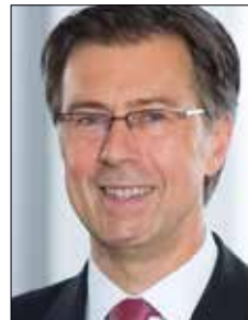
IC IMMOBILIEN GRUPPE

Die IC Immobilien Gruppe realisiert das Asset und Property Management für Gewerbeimmobilien im Allgemeinen sowie das Center Management im Speziellen für deutsche und internationale institutionelle Immobilieninvestoren. Seit mehreren Jahren arbeiten wir erfolgreich mit der BBE Handelsberatung zusammen. Bislang hat sie uns bei Projekten in Magdeburg, Celle und in Eisenhüttenstadt unterstützt. Die Handelsimmobilienchecks, mit denen die Experten der BBE Handelsberatung die jeweiligen Centerkonzepte und Mieten analysiert haben, und die konkreten Optimierungsvorschläge haben uns so überzeugt, dass wir die Ansätze zur Analyse in unser neues Vermietungs- und Strategiekonzept haben einfließen lassen.